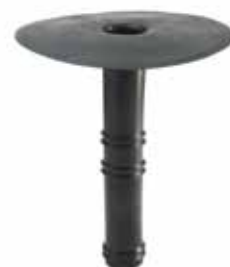
屋面排水孔 (用于沥青卷材)